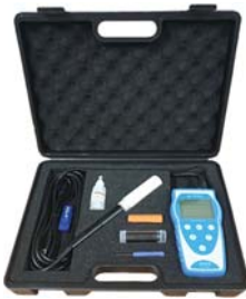
[ Full set 구성 ]